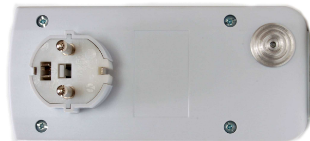
Detail teplotního čidla.

Pro spínání topení v mezích od 20 do 30 stupňů nastavíme TEPLOTA=ANO , TEPLOTAZAP=20 , TEPLOTAVYP=30 , pro klimatizace TEPLOTAZAP=30 , TEPLOTAVYP=20 .